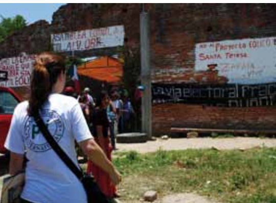
Voluntaria del Equipo Oaxaca en el Istmo de Tehuantepec en el marco del Seminario Internacional Megaproyectos de Energía y Territorios Indígenas “El Istmo en la Encrucijada”