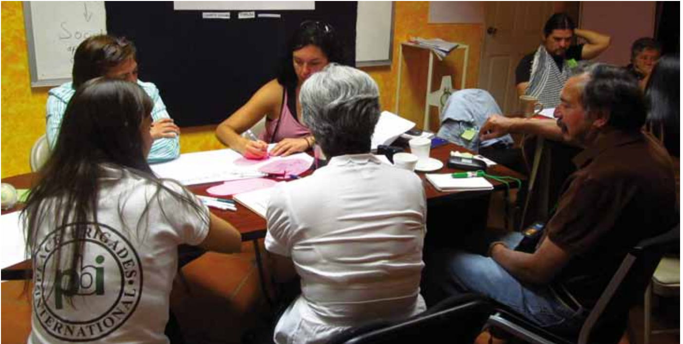
PBI imparte taller a personas defensoras en Ciudad Juárez, Chihuahua

peticiones de asesorías (seguridad e incidencia) muestran que los retos aún son grandes. PBI está convencido que ambos programas pueden tener un rol importante en el fortalecimiento y protección de defensoras y defensores en México.