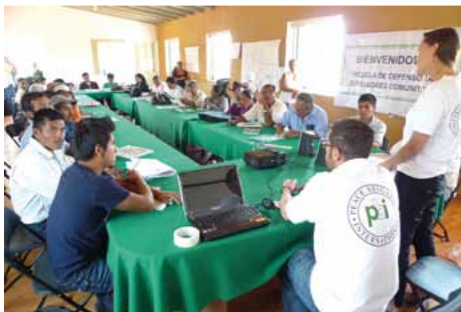
Miembros de PBI durante taller de seguridad impartido a defensoras y defensores comunitarios en Oaxaca

A pesar de estos logros, los números de agresiones a personas defensoras y de