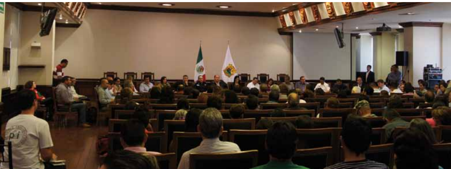
PBI hace presencia en el encuentro en Saltillo entre familias de FUUNDEC y autoridades gubernamentales para discutir la búsqueda de personas desaparecidas

Con la misión exploratoria concluida en el 2012 y la decisión de abrir un nuevo equipo de terreno en el norte del país, en el 2013 PBI México se enfocó en empezar el trabajo de acompañamiento en los estados de Chihuahua y Coahuila. Ambos han sido identificados entre los más peligrosos para la defensa de los derechos humanos 21 . PBI ha constatado ataques, amenazas, hostigamiento, vigilancia, agresiones físicas y criminalización en contra de defensores debido a su trabajo por los derechos humanos. En solo dos años, en el estado de Chihuahua cinco mujeres activistas fueron asesinadas y otras doce abandonaron el país debido a las amenazas en su contra 22 .