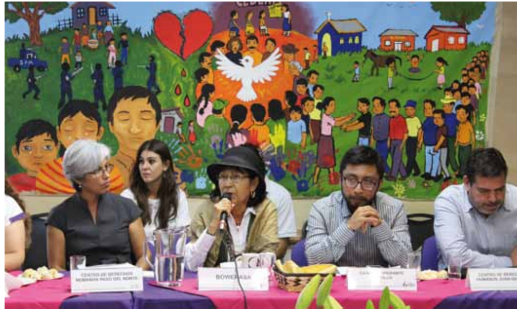
Personas defensoras participan en el evento de apertura del nuevo Equipo Norte en Chihuahua, octubre de 2013

Las organizaciones expresaron la necesidad de recibir capacitación en incidencia política y PBI empezó a diseñar un programa de asesorías en incidencia y creación de redes de apoyo. Esta nueva herramienta refleja el mandato de PBI de compartir estrategias que puedan empoderar a actores locales de la sociedad civil y ampliar su “espacio” de actuación, por lo que se fortalecerá en 2014 para que más personas defensoras puedan beneficiar.