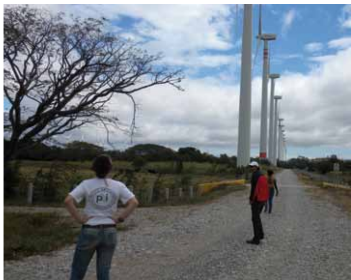
Voluntaria del Equipo Oaxaca con miembros de la sociedad civil cerca a turbinas eólicas en el Istmo de Tehuantepec

invitada por la Barra de Abogados de París. Como resultado de la gira, Amnistía Internacional y el Observatorio para la Protección de los Defensores de Derechos Humanos emitieron Acciones Urgentes sobre un caso expuesto por Alba. Además, Alba pudo cabildear, con otros actores, la resolución de las Naciones Unidas (ONU) contra la criminalización de personas defensoras, que fue aprobada el mismo mes.