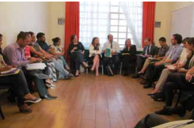
Encuentro entre personas defensoras y el cuerpo diplomático en el marco del lanzamiento del Panorama de la defensa de los derechos humanos en México

que, en representación de más de treinta y tres organizaciones y redes, expuso un diagnóstico de la situación de derechos humanos elaborado de forma conjunta, así como propuestas de recomendaciones. PBI considera positivo que más de un tercio de las 176 recomendaciones recibidas por México conciernen personas defensoras. Diversos países expresaron preocupación por la situación de riesgo de las y los defensores y pidieron al Gobierno mexicano fortalecer su protección y tomar medidas para evitar su agresión. México tiene hasta marzo para aceptar las recomendaciones; PBI considera fundamental que el Gobierno mexicano las adopte y actúe para apoyar y legitimar las personas defensoras.