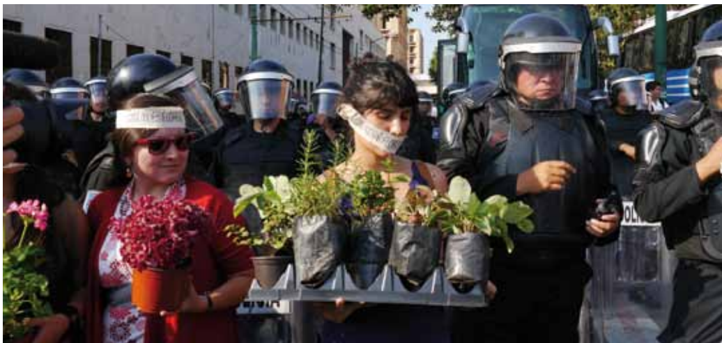
Manifestación del 2 de octubre en la Ciudad de México

la Procuraduría General de la República, Peña Nieto reconoció públicamente la importante labor de las y los defensores de derechos humanos 5 , y el Gobierno federal dio pasos positivos hacia el cumplimiento de Sentencias de la Corte Interamericana de Derechos Humanos (ver página 10).